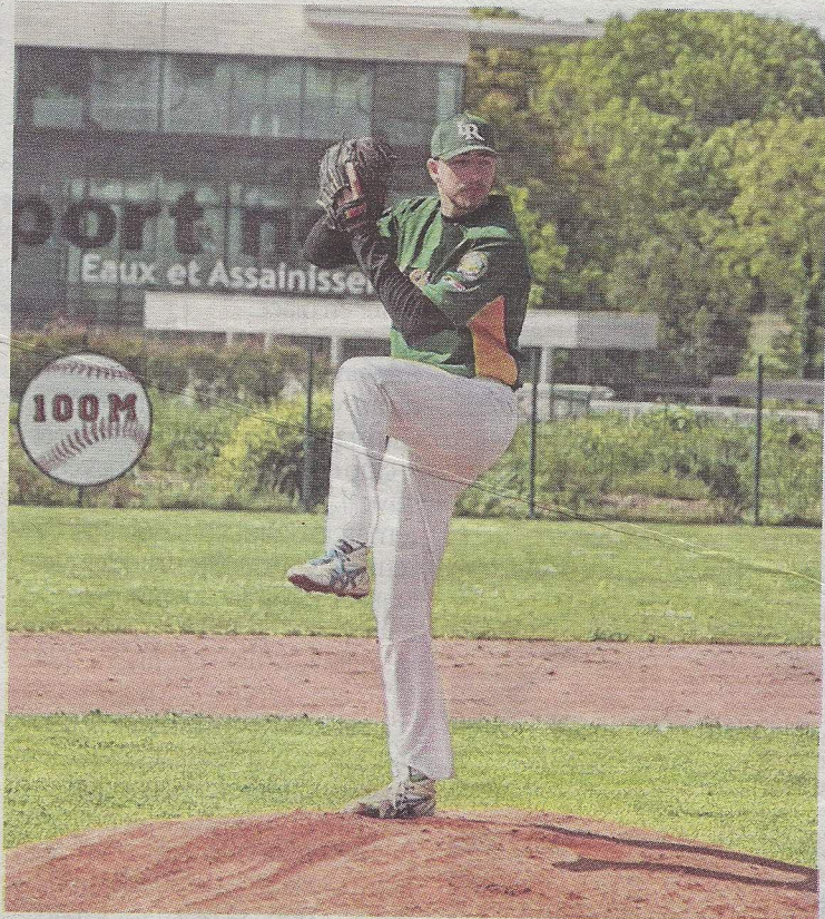
Le secteur des lanceurs sera primordial ces prochaines semaines, alors que le club a perdu un spécialiste.

Le match aurait même pu connaître un renversement ultime lorsque l'arbitre sanctionna le lanceur messin pour une feinte irrégulière. Un épisode qui créa une vive tension avec le coach lorrain, qui fut d'ailleurs sommé de quitter le terrain. Mais finalement, le score ne bougea plus.