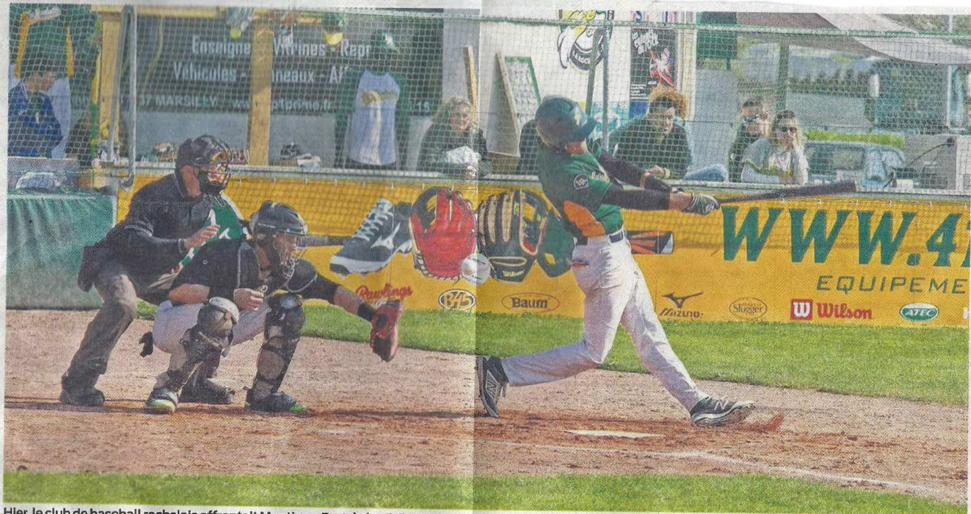
Hier, le club de baseball rochelais affrontait Montigny-Bret, à domicile. Après une matinée difficile où ils se sont inclinés 2 à 10, les Boucaniers se sont imposés 8 à 3 l'après-midi