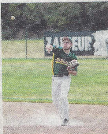
Il y avait trop d'écart.