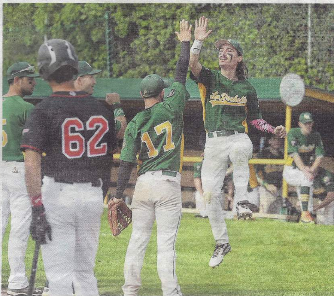
Les Boucaniers se sont imposés 4-1 le matin et 4-2 l'après-midi face aux Niçois.

La deuxième partie débutait un peu sur le même tempo. Il fallait attendre la 6 e manche pour voir un point inscrit, et il était pour le Cavigal, qui pouvait ainsi espérer remporter son premier match à l'extérieur cette saison. C'est alors qu'arrivait un coup épatant de Marcel Cremel, le jeune Boucanier,