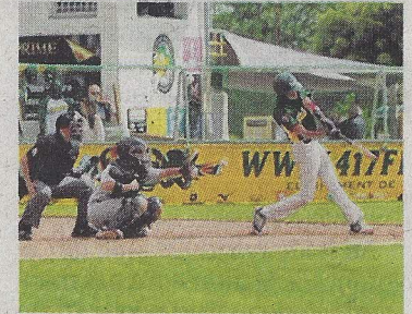
Les Boucaniers sont en bonne position.