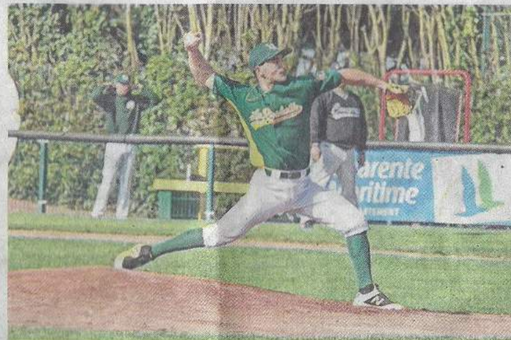
Les lanceurs rochelais ont fait belle impression.