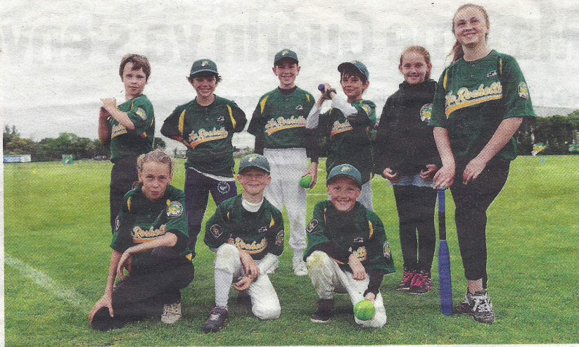
Alors que le club rochelais n'a pas compté d'enfants parmi ses licenciés pendant dix ans, les jeunes font à nouveau partie des forces vives d'une association en mouvement.