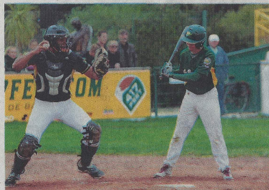
Les Rochelais sont tombés contre plus fort, ce week-end. Place à l'intersaison, les dossiers ne manquent pas.

Un public qui a encore des diffi- cultés à se déplacer, témoin la ma- grelette cinquantaine de personnes présentes lors du match 3 de la de-