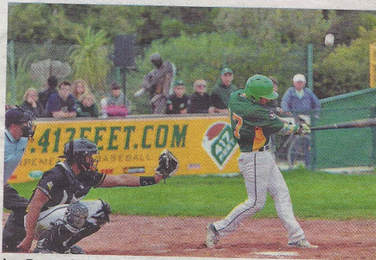
Les Boucaniers ont perdu cette demi-finale trois manches à zéro face aux Duffy Ducks (15-7, 23-14, 18-8).

Cette saison 2016, dite « de travaux », est à présent terminée pour des Boucaniers qui vont poursuivre l'entraînement jusqu'à mi-décembre, avant un mois de trêve hivernale.