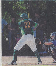
La victoire est impérative, samedi, pour viser la finale. X.L.

Les deux formations se retrouveront une semaine après le double des Pontambertois, ce week-end, pour l'ouverture de la série. Ceux-ci ont en effet pris le meilleur face à des Maritimes privés de deux de leurs trois joueurs étrangers - seul Forrest Crawford étant encore au club - quand eux étaient au complet. Samedi, les joueurs de La Rochelle devront donc impérative-