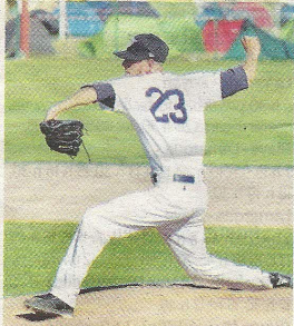
À La Rochelle, premier All Star Game Baseball de France. R.A.