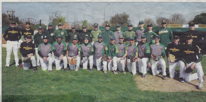
Le groupe senior et U18 Boucaniers pour cette saison qui va bientôt débiter.