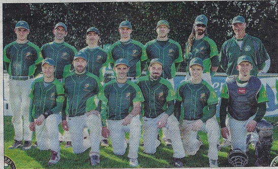
L'équipe de Nationale 2 des Boucaniers.

Le 1 er match se terminant par une victoire Rochelaise 21 à 8.