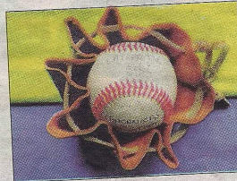
La La Fayette Ball a popularisé le club.

En 1964, les militaires américains quittent la base de Rochefort, emportant avec eux la pratique de leurs loisirs comme le baseball. En 2014, le club des Canonniers de Rochefort naît. Une équipe seniors est constituée et se classe à la deuxième place du championnat régional, en jouant ses matchs à La Rochelle faute de terrain à Rochefort. Durant l'été dernier, le club des Canonniers se fait connaître en s'associant au grand projet de « L'Hermione ». En effet, une