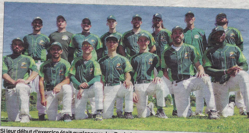
Si leur début d'exercice était quelconque, les Rochelais ont assuré devant la lanterne rouge.