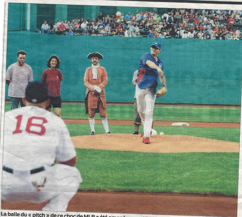
La balle du « pitch » de ce choc de MLB a été amenée par « L'Hermione ».