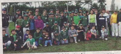
L'académie compte 71 licenciés à Montendre.

La Boucaniers base-ball académie de Montendre (BBAM) est née de la rencontre entre le club des Boucaniers de La Rochelle (un des 10 meilleurs de France) et les classes option base-ball du collège Duménil de Montendre. Du reste, la BBAM est le centre de formation délocalisé du club rochelais, et accueille des garçons et filles entre 6 et 18 ans, au sein d'une équipe de 18U, 2 équipes de 15U, une 12U et quelques petits de moins de 9 ans. La structure compte 71 licenciés