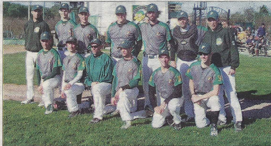
L'équipe B a mieux fini qu'elle n'avait commencé.