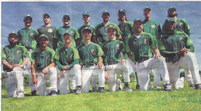
Les Boucaniers ont terminé leur saison. Ils ont échoué en demi-finale face à Toulouse.