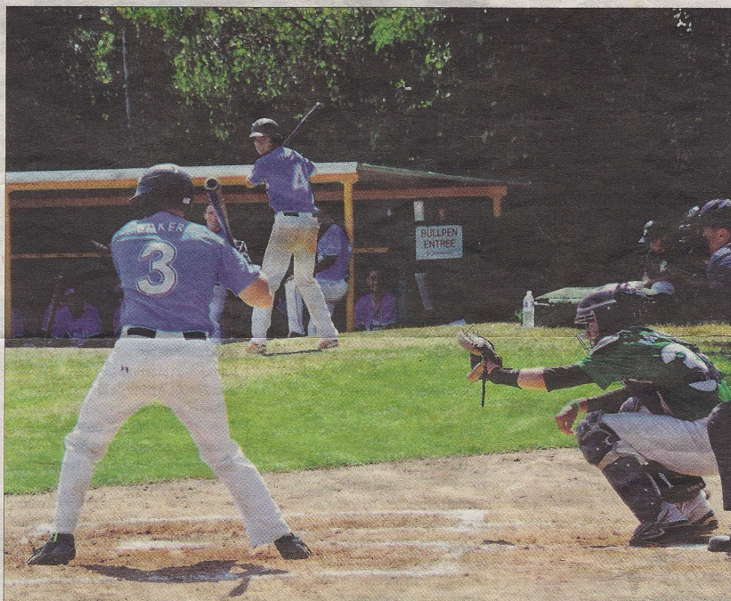
90 joueurs venant du monde entier participent au tournoi.

La Rochelle constitue l'étape française de la compétition itinérante. C'est le stade des Boucaniers qui avait attiré l'œil de l'organisateur du tournoi, venu des Pays-Bas passer ses vacances dans l'île de Ré. Mais, avec 300 clubs et 12 000 licenciés, le baseball reste encore un sport confidentiel en France. Alors, profitant du tournoi pour faire connaître le sport, le club organise des initiations originales : une bâche tendue au sol permet par exemple d'apprendre aux