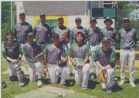
Les Boucaniers frappent fort, cette saison.