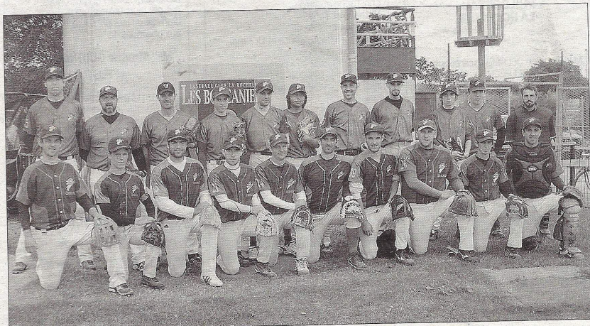
Le groupe senior des Boucaniers.

LA ROCHELLE Le titre régional qu'ils viennent de décrocher les qualifie pour la Nationale 2. Et ils ne veulent pas s'arrêter là