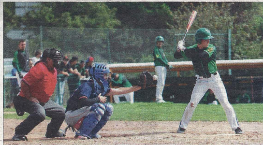
Les Boucaniers ne se sont pas troués, hier.