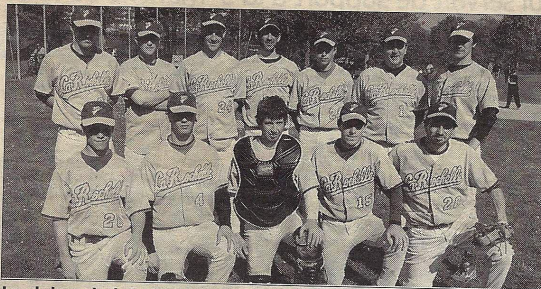
Le club rochelais peut envisager la montée.