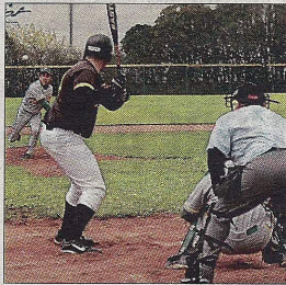
Les Boucaniers reçoivent leurs dauphins dimanche.

L'équipe de Promotion Honneur, composée essentiellement de jeunes et nouveaux joueurs, continue son apprentissage, s'améliorant de match en match. Les défaites contre Angoulême et Châtelleraut par des scores très serrés laissent à penser que les rookies rochelais devraient bientôt fêter leur premier succès.