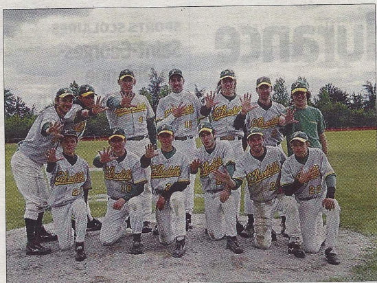
L'équipe des Boucaniers.