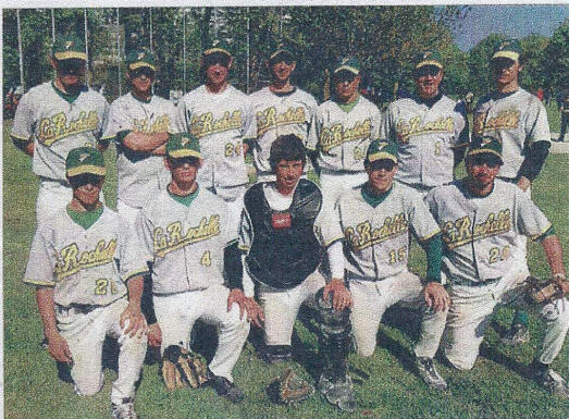
L'équipe rochelaise championne régionale.