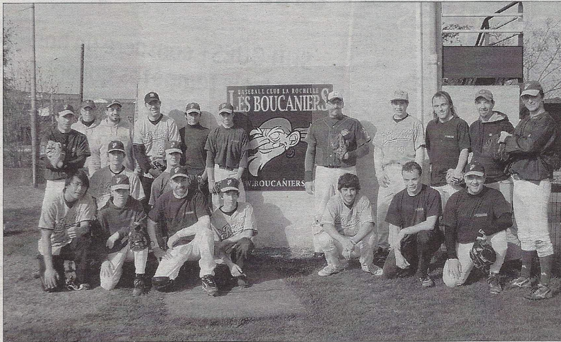
Les Boucaniers sur leur terrain de Port-Neuf.

LA ROCHELLE Les groupes de DH et de PH des Boucaniers visent la catégorie supérieure. Les entraînements s'intensifient