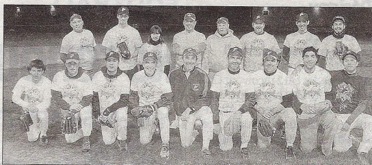
Deux des équipes du championnat interne de softball.

LA ROCHELLE Le club compte sur un effectif de 25 joueurs pour monter en N 1