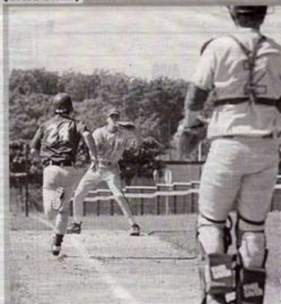
Les Boucaniers battus. Face au leader Thiais, les Boucaniers de La Rochelle ont perdu les deux manches, dimanche, sur leur terrain de Port-Neuf (15-9 et 16-9). Ils se retrouvent derniers avant trois déplacements d'affilée à Rennes et en région parisienne. La première phase se termine mi-juillet et les Rochelais joueront les play down en septembre. Pour ne pas descendre, ils devront éviter la dernière place.