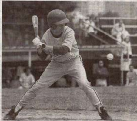
Boucaniers. Les Rochelais à l'attaque. La facile victoire contre Eysines confirme les bons résultats de cette saison.

La Nationale 1, les Boucaniers l'ont connue pendant huit ans, ce qui n'est pas le cas du club adverse. Les joueurs d'Eysines ont commis beaucoup trop de fautes, tant du côté offensif que défensif, pour espérer contenir la fougue rochelaise. Ce club, qui a déjà été trois fois champion d'Aquitaine, était diminué : seuls neuf joueurs ont fait le déplacement sur le terrain de Port-Neuf, excluant ainsi les remplacements au long d'un match qui a duré trois heures. De bons éléments manquaient pour cause de... baccalauréat : quatre joueurs ont été interdits de rencontre par leurs parents après leur échec à l'examen. Les Boucaniers ont su profiter de cette ab-