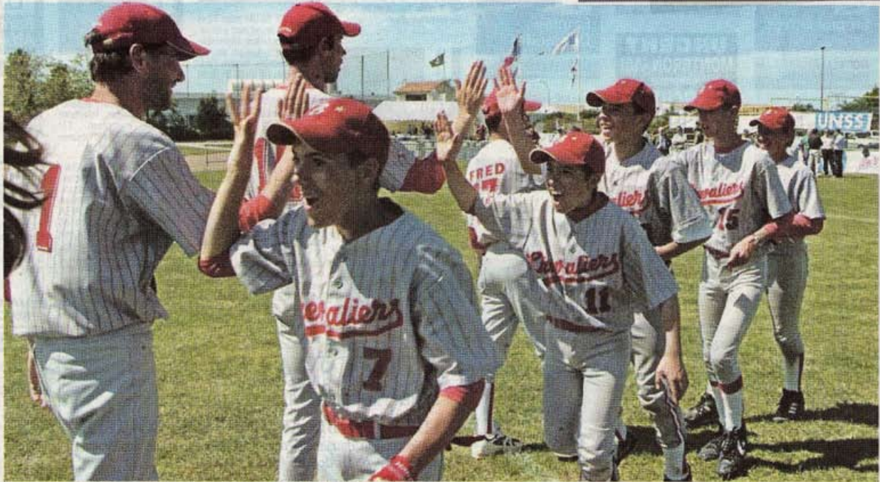
Bravo. Les collégiens de Beaucaire se félicitent après la finale gagnée contre Nice

Enfin, à 14 heures, le moment tant attendu de la finale, ce par une chaleur toute méditerranéenne, avec l'opposition entre les deux équipes habituées à la chaleur; Beaucaire et Nice. Une confrontation largement domi-