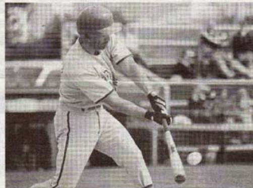
Swing. Les Rochelais n'ont pas eu de réussite à la batte face au PUC.

Budget en hausse. Avec deux défaites en deux rencontres, les