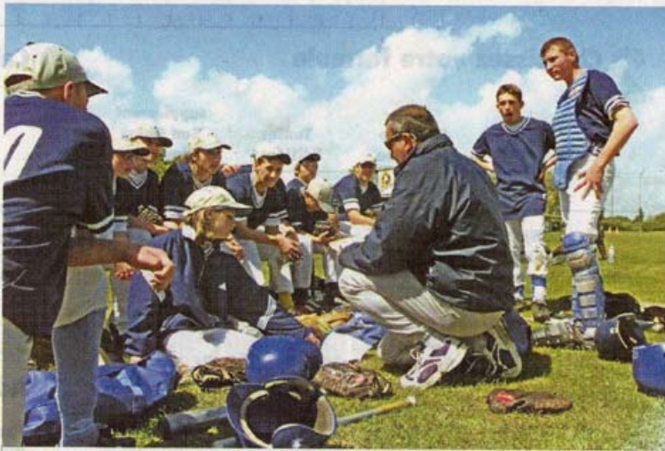
Consignes. Montendre n'a été écarté des demi-finales qu'au goal average