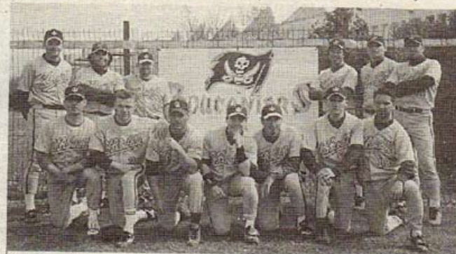
N 1. C'est l'objectif de la jeune équipe des Boucaniers, qui est repartie à l'abordage de l'élite cette saison

Au softball. Division que le club connaît déjà bien puisque l'équipe senior a fait partie de cette élite du baseball français pendant de nombreuses années. Mais cette nouvelle dynamique se note aussi au travers de la reconstitu-