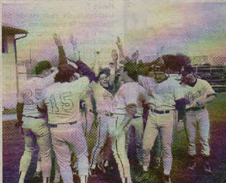
Victoire ? Les Boucaniers ont déjà passé un tour. Réussiront-ils la passe de deux ce week-end ?

Contre le PUC. En attendant, demain, après une démonstration de ce sport à la foire-exposition de La Rochelle, les équipiers premiers attaqueront un week-end très important pour l'avenir sportif du club puisqu'ils disputeront deux matches