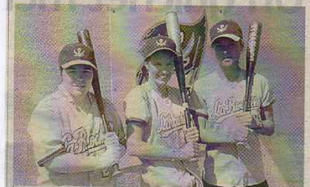
Joueuses. Le club des Boucaniers recrute des filles et aussi des garçons.

■ Le baseball n'est pas véritablement médiatique en France. Mais que dire du softball ? Ce sport est méconnu alors qu'il est pratiqué dans le monde entier et que son succès outre-Atlantique n'est plus à démontrer.