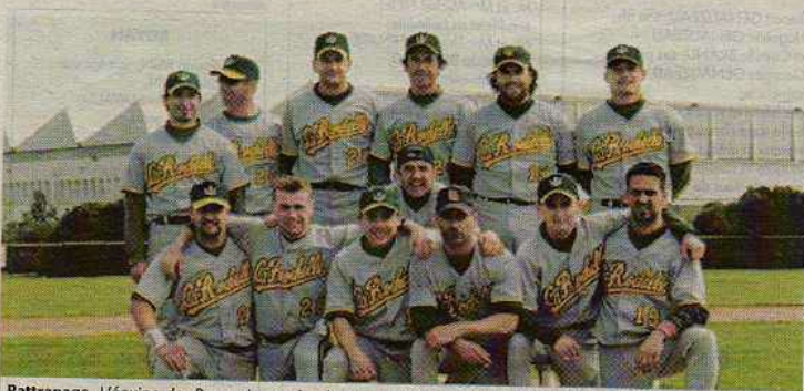
Rattrapage. L'équipe des Boucaniers, grâce à un bon dossier, a obtenu le droit de jouer en première division.

Après une saison forte en émotions, les Boucaniers de La Rochelle ont enfin réussi à décrocher leur place au sein de la première division française de baseball. En effet, l'équipe première a, durant toute la saison 2002, réalisé de très belles performances et ce, grâce à un groupe de joueurs tant dynamiques que déterminés à accéder au haut-niveau. C'est aujourd'hui chose faite car même si les phases finales s'étaient avérées quelque peu difficiles pour les Boucaniers, notamment lors d'un plateau où se rencontraient les équipes de Béziers, du PUC et de La Rochelle, le pari est aujourd'hui relevé. Tout au moins, il est engagé car reste maintenant à préparer physiquement et mentalement l'équipe