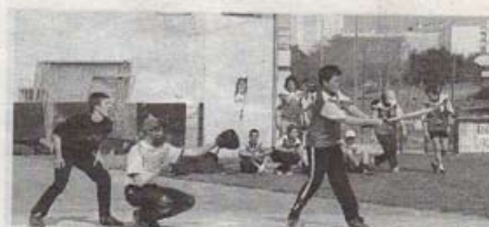
Début. Les collégiens commencent la compétition aujourd'hui dès 9 heures sur le terrain de Port-Neuf

Au total, ce seront 120 collégiennes et collégiens encadrés de deux accompagnateurs par équipe qui sont présents durant trois jours à La Rochelle. Tous, compétiteurs et encadrement soit 136