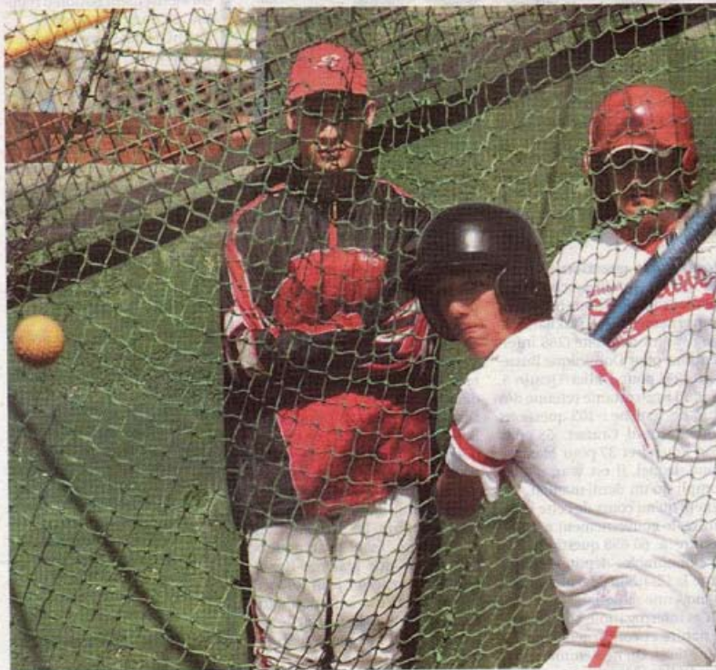
Les équipes scolaires se rencontrent sur les installations du club des Boucaniers à Port-Neuf

Championnat. Les finales scolaires de base-ball se disputent aujourd'hui à La Rochelle. Parmi les équipes, celle du collège Dumenieu de Montendre, qui a lancé cette discipline en milieu scolaire. → PAGE 17