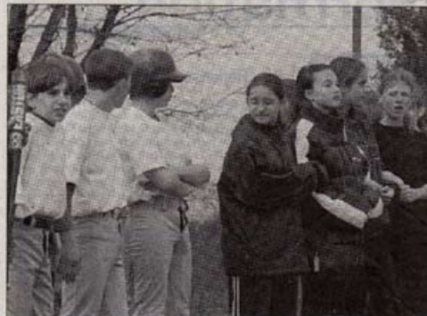
Les suppotrices étaient au rendez-vous

Dans la catégorie benjamins, en championnat départemental, Montendre bat Rochefort 14 à 1. Montendre est donc champion départemental et Rochefort, second. Les organisateurs remercient le club de La Rochelle pour l'aide à l'organisation de cette compétition.