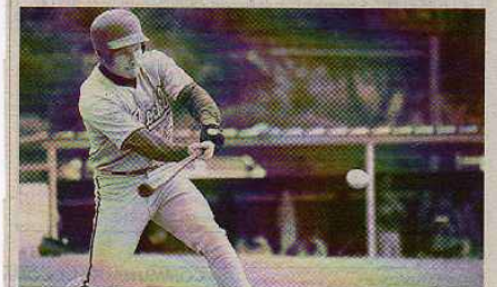
Club. Les Boucaniers, ici en action, accueillent ces championnats de France