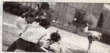
Le base-ball repart à La Rochelle

Le site web officiel des Boucaniers apparaîtra quant à lui dans les prochaines semaines.