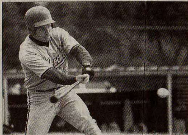
Le frappeur doit envoyer la balle le plus vite possible avec des effets

tour à tour à la batte pour essayer de frapper la balle lancée par le lanceur vers le receveur et de courir en touchant un à un les coussins des bases 1, 2, 3 et le marbre (plaque de but).