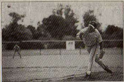
Le lanceur doit piéger le frappeur d'un geste rapide et sûr.