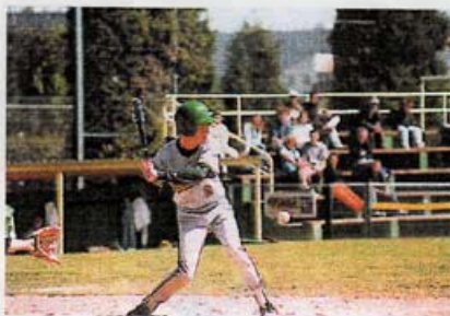
Le temps de jouer la balle, celle-ci est déjà arrivée, trop tard pour le batter!

touché, entre deux bases, par un défenseur en possession de la balle. De même il se fait éliminer si un défenseur muni de la balle se trouve avant lui sur la base où il est obligé de se rendre. Lorsque les défenseurs ont éliminé 3 attaquants, ils passent à leur tour à l'attaque (au bat). Le passage des deux équipes au bat constitue une reprise. Un match senior dure neuf reprises.