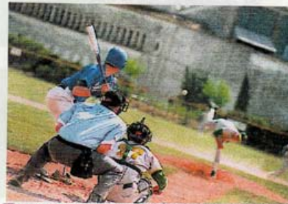
Tous les acteurs du duel lanceur-frappeur sur le même image. L'arbitre, placé derrière le receveur juge la trajectoire des balles.

C'est en 1845 qu'Alexander Cartwright (prononcez comme vous le pouvez) élabora les premières règles, mais les plus importantes du baseball. A l'origine, la balle n'était qu'un petit sac de céréales qu'il était facile de contrôler à main nue. Au fil du temps cette balle devint de plus en plus dure. Charles Waitt (en français dans le texte, Charles Attend) fut le premier en 1875 à utiliser un gant pour amortir le choc que produisait la balle lors de la réception. Quelques années plus tard (1879) apparut un gant avec une poche entre le pouce et l'index (dénigré par les puristes). Les joueurs avaient l'habitude de faire eux-mêmes leur propre gant. Il faudra attendre 1920 pour qu'un ancien joueur, Rawling, créé et commercialise un gant standard, le «bill doak».