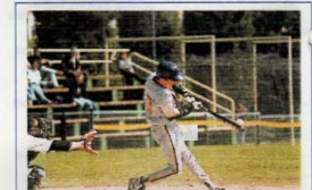
Technique parfaite : les yeux fixés sur le point d'impact, jambe avant tendue, jambe arrière fléchie. Frappez la balle devant le marbre.

Un des gestes les plus difficiles à réaliser est probablement la frappe (il va de soit, réussie) d'une balle de baseball avec une batte (voir encadré). Sachez que l'attaquant est seulement à 18,44 m du lanceur, (dont le but avoué est de lancer la balle de telle façon que son adversaire rate son coup).