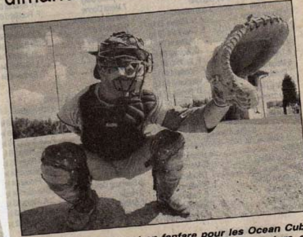
Début de championnat en fanfare pour les Ocean Cubs qui accueillent Cherbourg dimanche en ouverture du championnat de N1B

Pour sa onzième saison, le club de base-ball des Ocean Cubs retrouve sa place au haut niveau en nationale 1B.