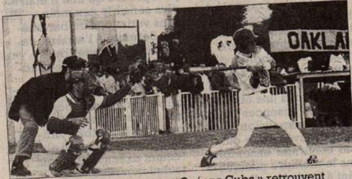
Le base-ball rochelais et les « Océans Cubs » retrouvent la N1B

Les « Océans Cubs » de La Rochelle retrouvent la N1B dimanche prochain