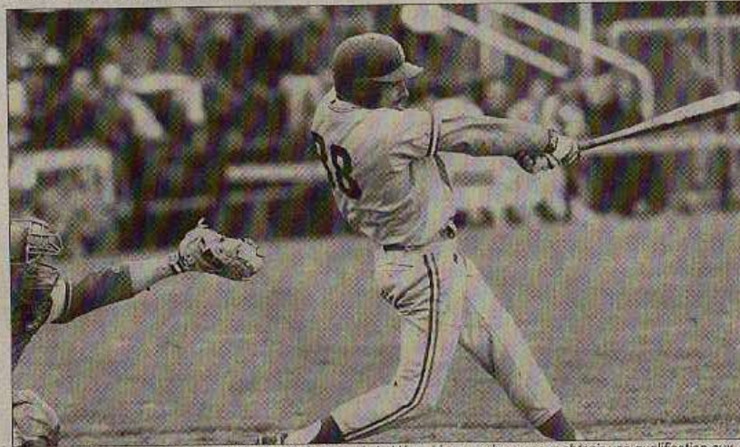
L'équipe de France cherche à se hisser au premier rang de la hiérarchie européenne pour obtenir une qualification aux JO

◇ PROGRAMME : aujourd'hui, finale pour la 3ème place vers 11 heures. Finale à 15 heures.