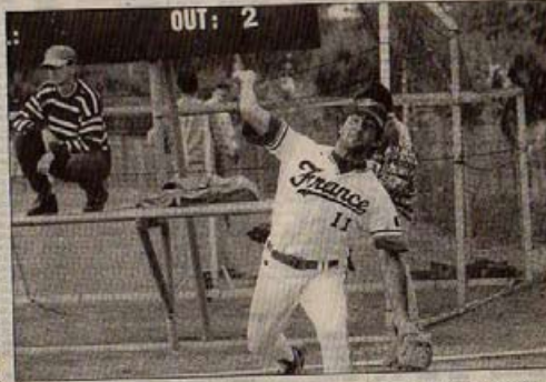
L'équipe de France défend son trophée à partir de samedi à La Rochelle.