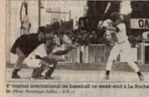
4 e tournoi international de baseball de week-end à La Rochelle. - 01.11

C'est week-end de Pentecôte va être très riche en émotions pour les amateurs de sport le plus pratiqué dans le monde. Le baseball, puisque c'est de cela qu'il est question, est à l'honneur à La Rochelle, avec la quatrième édition du tournoi international organisé par le club local, les «Ocean Cubs».