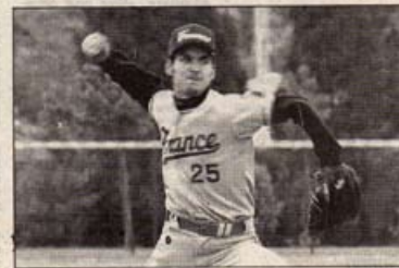
La France a battu l'Espagne en finale

Avec une moyenne d'âge de 23-24 ans, la France est une formation en devenir. Grâce à ses clubs phares Saint-Lô, Nice, Montpellier, Savigny, elle a tous les atouts en main pour gravir les échelons sur l'échelle du