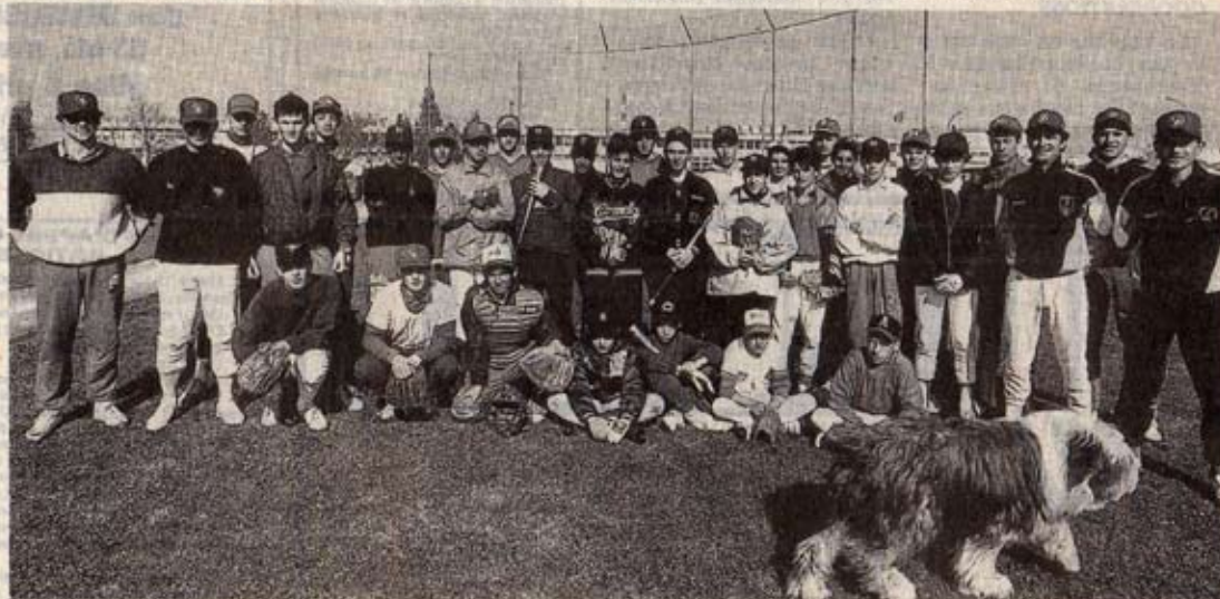
Les cadets nationaux

L'organisation de ces stages permet donc au base-ball d'apporter sa contribution aux diverses actions menées pour faire connaître et promouvoir notre ville ».