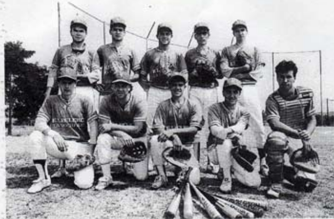
L'équipe de La Rochelle

La Rochelle en Nationale 1B : une saison que le club de Regnier ne veut pas rater