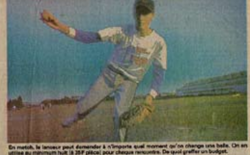
En match, le lanceur peut demander à n'importe quel moment qu'on change une balle. On en utilise au minimum huit (à 35F pièce) pour chaque rencontre. De quoi griffer un budget.