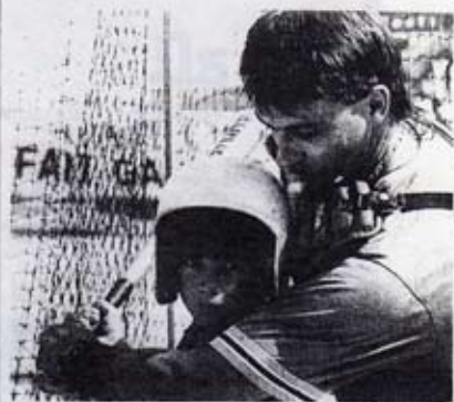
L'initiation au base-ball, une activité attrayante pour les jeunes. La Rochelle possède un club de bon niveau depuis quelques années déjà.