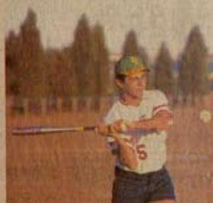
Un mélange de vitesse, de puissance et d'adresse.

«C'est plus qu'un sport, c'est un style, une nouvelle façon d'appréhender. Un projet, j'ai eu un camp de trois semaines en Géorgie, j'ai une forte envie de progresser. Sch, espère un peu de base de base et de base.