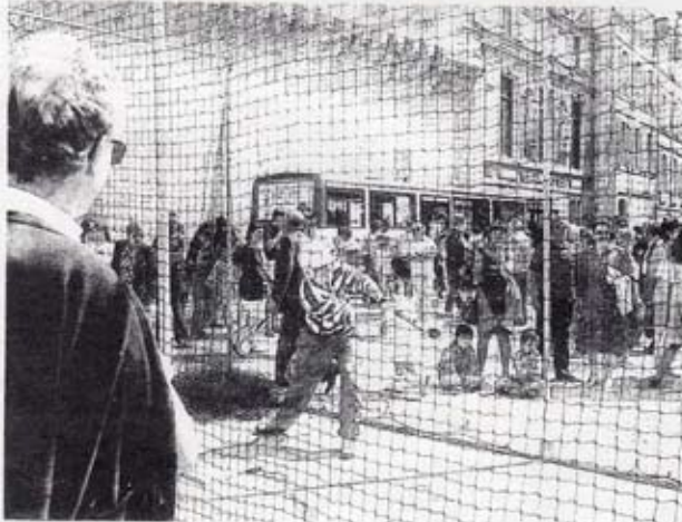
Près de 200 manifestations dans toute la Charente-Maritime, des opérations originales : la Fête du sport a connu une complète réussite. Comme, ici, du base-ball sur le port de La Rochelle et la grande horloge derrière le filet.