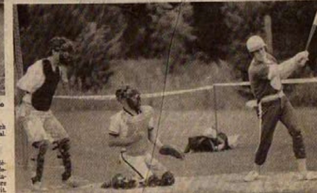
Les cadets de l'Océan-Club, la relève invaincue jusqu'à dimanche dernier

Lorsqu'il arrive aux abords d'un terrain de base-ball, le journaliste moyen, c'est-à-dire sans intérêt aux subtilités de ce sport, a l'impression soit d'arriver dans un pays dont la langue lui est inconnue soit de jouer dans une nouvelle version de « la Quatrième dimension ». En résumé, il n'y comprend absolument rien : les mots