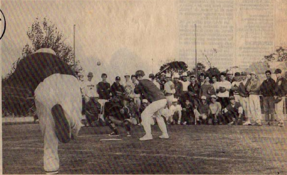
Entraînement, batte en main, deux fois par semaine au lycée Valin

Depuis maintenant un peu plus d'un an, une cinquantaine de Rochelais se sont pris de passion pour un drôle de jeu, qui se joue dans un champ en forme d'arc de cercle délimité par quatre « bases », autour duquel court un attaquant armé d'une batte en aluminium, pendant qu'un défen-