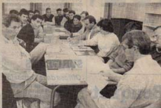
Les responsables des clubs de La Rochelle, Saint-Jean-d'Angély, Châtelleraut, Poitiers et Angoulême ont créé la ligue Poitou-Charentes de base-ball

A partir de mars 1988, le base-ball aura son championnat régional