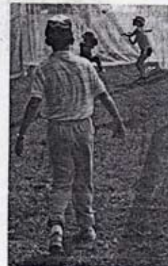
Der Flyers-Nachwuchs beim Training.

09.00: Aarau Hawks-Rottweil Sharks, 11.00: Juniorenspiel, 12.30: Zürich Lions-Therwil Flyers, 14.30: Damenspiel, 16.00: Ocean Cubs-Suc Strasbourg.