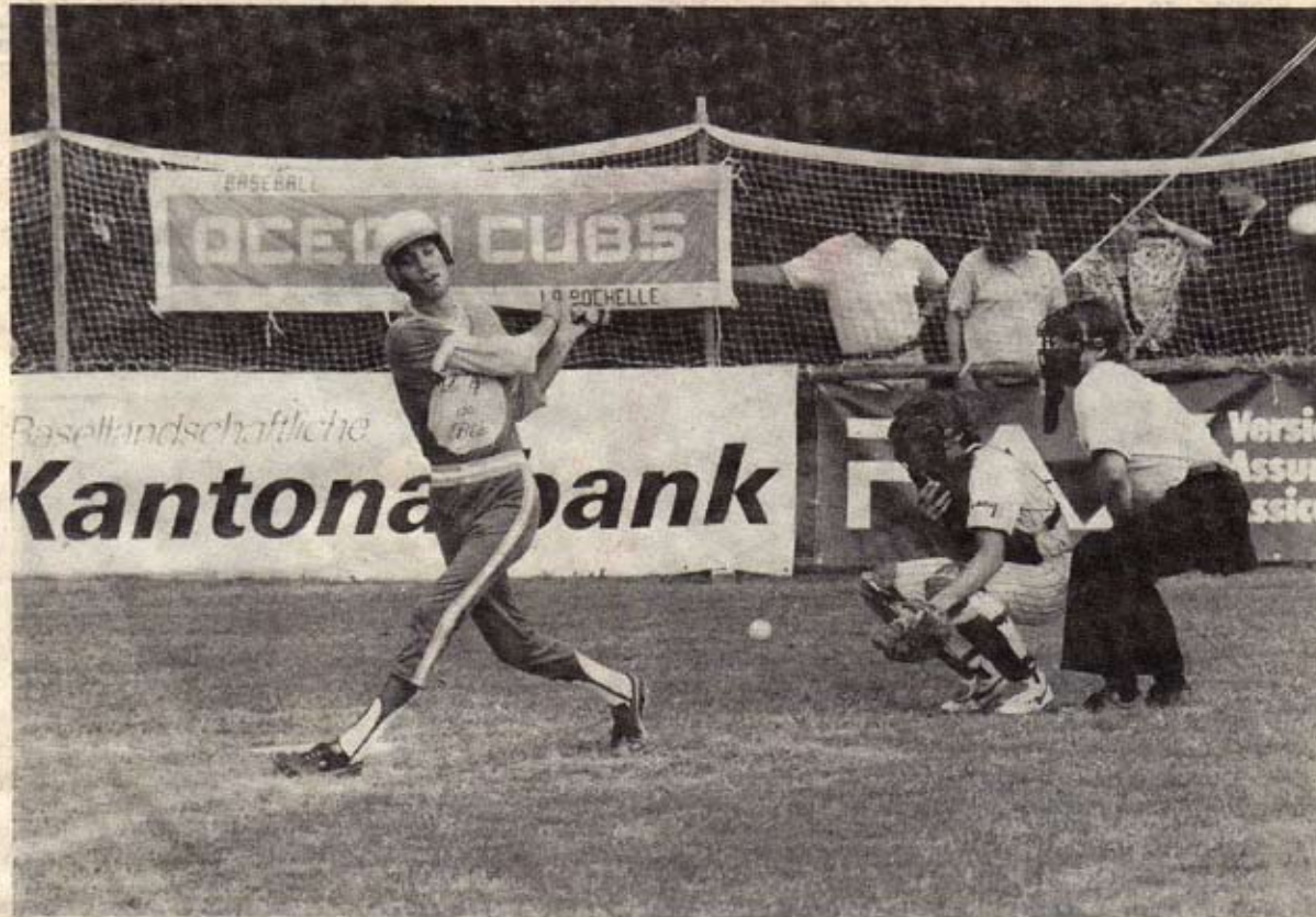
Wenn der Ball getroffen wird, nützen auch die Netze wenig.