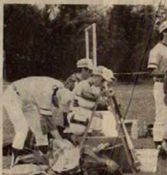
La mise au point de la tactique, avant d'entrer dans