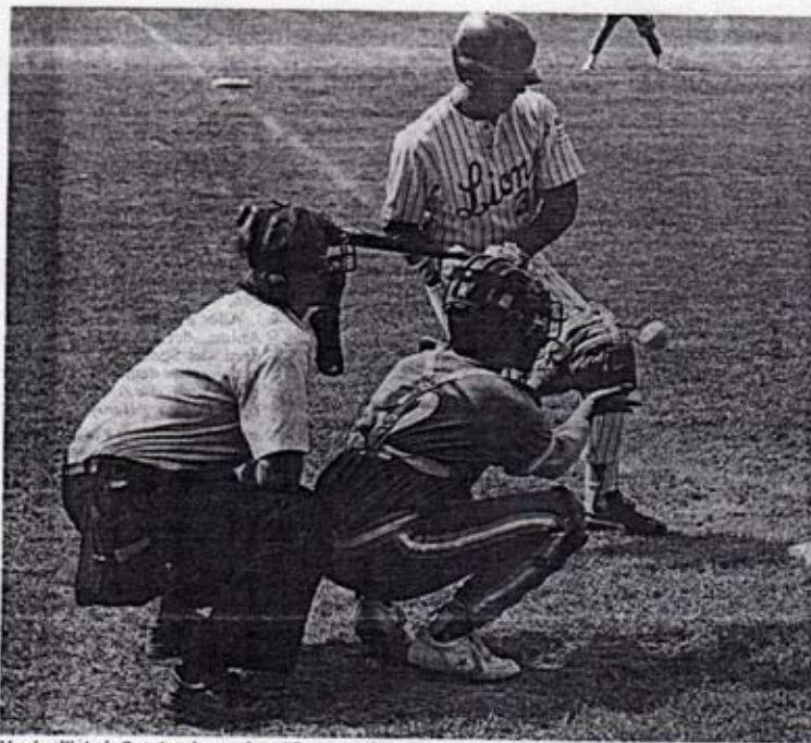
Umpire (links), Catcher (unten) und Batter auf der Therwiler Känelmatte in Aktion.

Zum fünften Mal organisieren die Therwil Flyers an diesem Wochenende ihr internationales Baseball-Turnier. Nach der gestrigen Vorrunde werden heute die Finals ausgetragen.