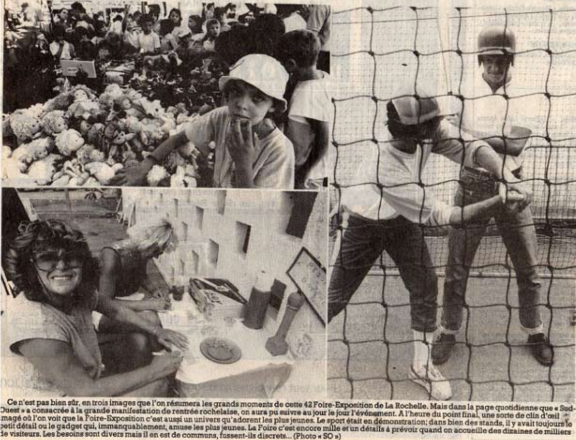
Ce n'est pas bien sûr, en trois images que l'on résumera les grands moments de cette 42 Foire-Exposition de La Rochelle. Mais dans la page quotidienne que « Sud-Ouest » a consacrée à la grande manifestation de rentrée rochelaise, on aura pu suivre au jour le jour l'événement. A l'heure du point final, une sorte de clin d'œil imagé où l'on voit que la Foire-Exposition c'est aussi un univers qu'adorent les plus jeunes. Le sport était en démonstration; dans bien des stands, il y avait toujours le petit détail ou le gadget qui, inmanquablement, amuse les plus jeunes. La Foire c'est encore mille et un détails à prévoir quand on accueille des dizaines de milliers de visiteurs. Les besoins sont divers mais il en est de communs, fussent-ils discrets...