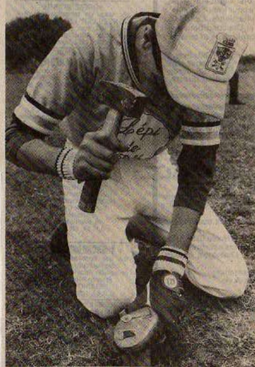
A La Rochelle, on veut continuer d'enfoncer le clou !