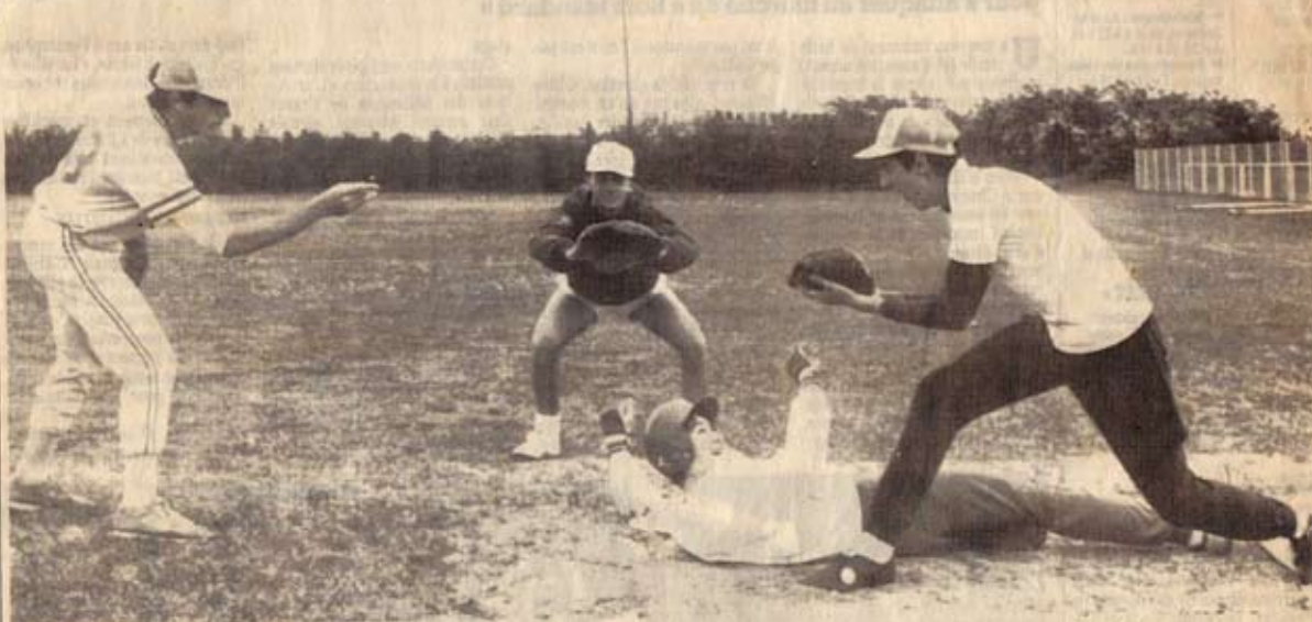
Dernier entraînement pour les Rochelais avant d'affronter les Parisiens

Dimanche, sur leur terrain du Pas-des-Laquais, les joueurs de l'Océan-Club accueillent le Base-Ball Club de France de Paris