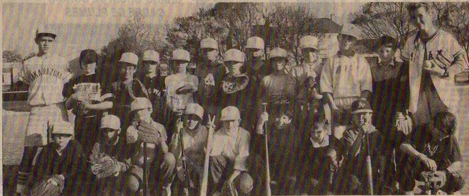
La relève de l'Océan-Club

Le Baseball-Club Rochelais doit penser à sa relève à long terme. Il lui faut durer