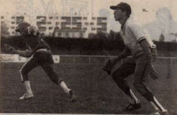
Un Angérien attend la balle, alors qu'un Rochelais court vers la base suivante

Les deux clubs ont confirmé leurs belles dispositions actuelles