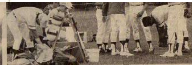
La mise au point de la tactique, avant d'entrer dans le vif du sujet