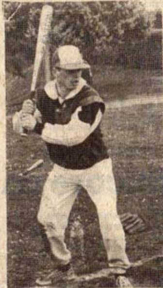
Première sortie en public des « Quizz », vendredi à Saint-Jean-d'Angély

Pour familiariser le public avec ce nouveau sport, un speaker commentera de façon détaillée ces rencontres. Pour promouvoir le base-ball, les spectateurs bénéficieront d'entrées gratuites et pourront, à partir de 11 heures, s'initier en prenant eux-mêmes en main gant, batte et balle. Bien que la moyenne d'âge des recrues soit généralement assez jeune, il est n'est pas rare de voir des joueurs dépasser la fourchette des 20 à 30 ans, sans pour autant être ridicules.