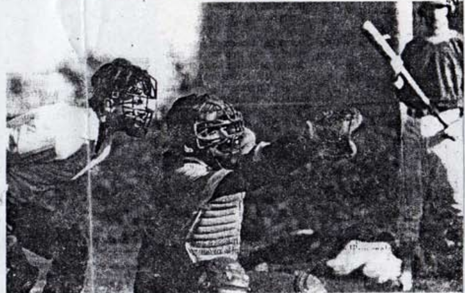
Le « catcheur » à la réception. Dans son dos, l'arbitre juge de la validité du lancer.