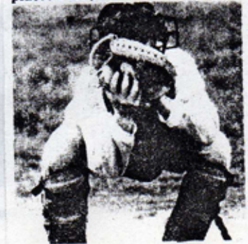
Le « catcheur » en action

■ La finale du Challenge d'Aquitaine opposera demain à 14 heures sur le terrain d'honneur du Passage (près des tennis) les Pitchers de Pineuilh aux clubs de La Rochelle. Il s'agira là de la première rencontre de base-ball ayant jamais eu lieu dans le département. Et le tout nouveau club d'Agen, déjà fort de cinquante licenciés mais non encore engagé en compétition, compte bien sur l'occasion pour faire découvrir aux Lot-et-Garonnais un sport qui, s'il est encore confidentiel en France vient d'être admis dans le giron olympique. Neuf joueurs par équipe, tantôt attaquants tantôt défenseurs. Une saison qui débute en avril pour, en principe se terminer à la mi-octobre. Demain au Passage ce sont les deux meilleures équipes des régions Aquitaine, Midi-Pyrénées et Poitou-Charentes, qui en découdront pour le sacre du grand, très grand Sud-Ouest. L'entrée sera libre. Une tribune de 200 places a été prévue.